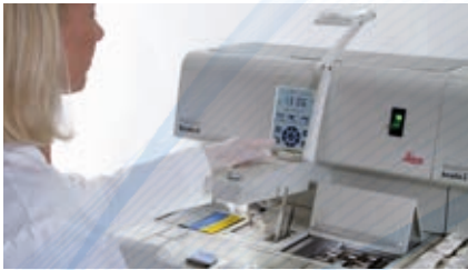
スムーズなワークフロー

作業の妨げとなるものを排除した対称的な作業スペースは、カセット、モールド、その他のアクセサリを温かく保ちながら手の届くところに設置しているため、 スムーズなワークフロー を実現しています。